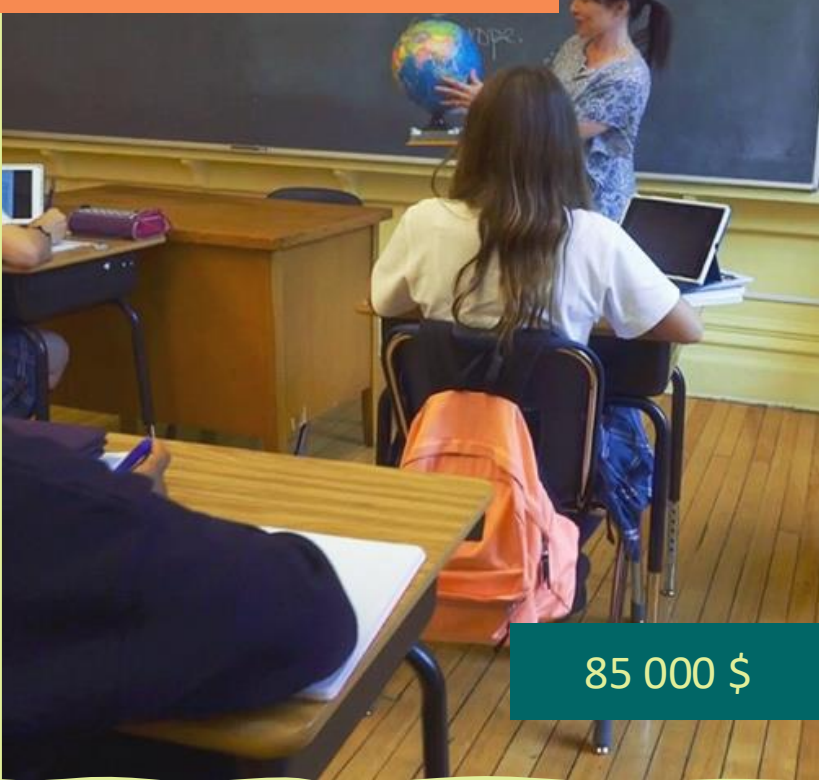
Salle d'étude et classes